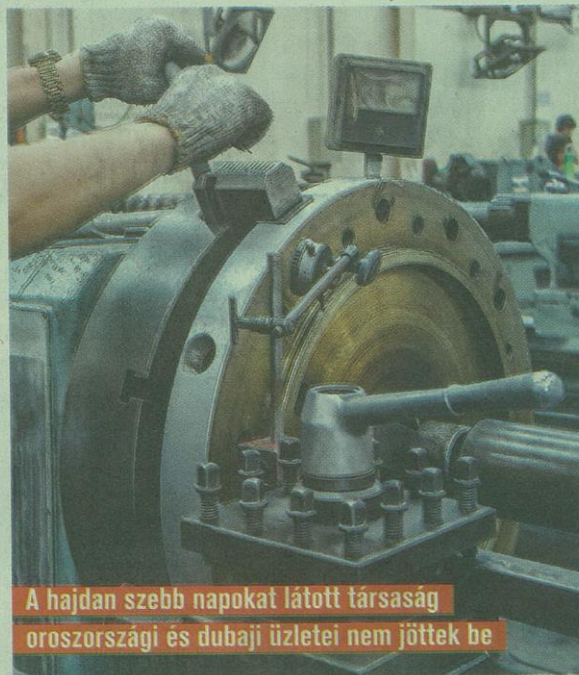
A hajdan szebb napokat látott társaság oroszországi és dubaji üzletei nem jöttek be

A cégcsoport először 2016. december 31-én jelentett negatív konszolidált saját tőkét, amely akkor mintegy mínusz 60 millió forint volt. Tavaly a holding első félévi beszámolójában már megközelítette a 370 millió forintos a negatív saját tőke. Azóta javult a helyzet, a szeptember végén megjelent első féléves jelentés szerint több mint 100 millió forintra mínusz 243 millió forintra változott a cég saját tőkéje.