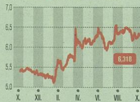
A GAZPROM-KÖTVÉNY HOZAMA | 2017. október 23. - 2018. október 23. (százalék)

az Oroszország koronaékszerének tartott Gazprom esetében a csökkenés kockázatát vagy a kötvény visszafizetési kockázatának nagyobb