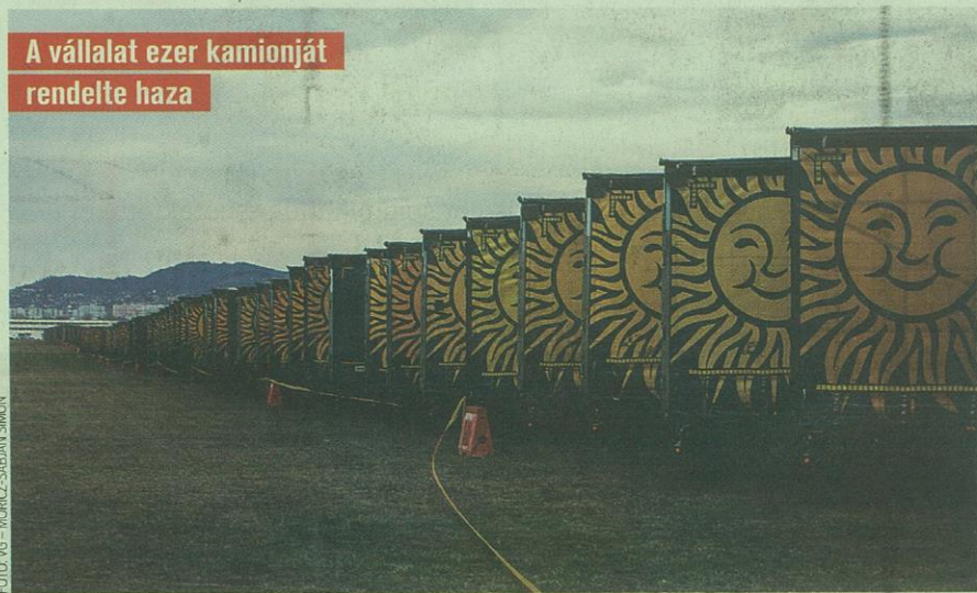
A vállalat ezer kamionját rendelte haza