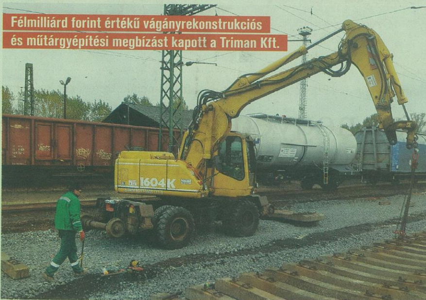
Félmilliárd forint értékű vágányrekonstrukciós és műtárgyépítési megbízást kapott a Triman Kft.